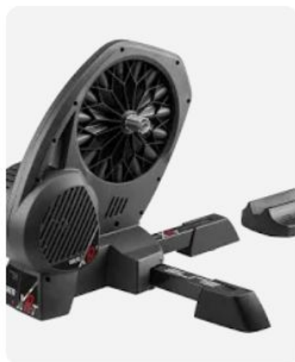
Elite Direto XR